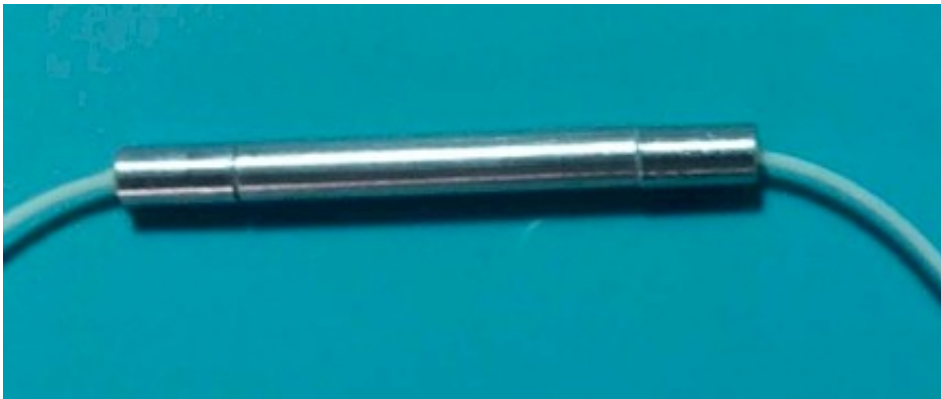
Fiber Bragg Grating Temperature Sensor OETMS-100B