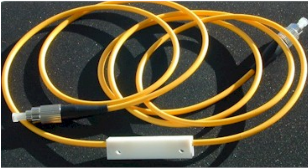
Fiber Bragg Grating Temperature Sensor in PTFE OETMS-200

Estos sensores poseen caja aislante (teflón) y poseen un rango de medida que va desde los -50^{\circ}\text{C} hasta los +120^{\circ}\text{C} .